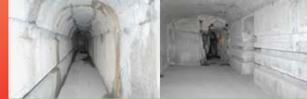
Notranji hodnik in bivalni prostor v utrdbi na Primožu. Corridor and living quarters in Primož fortress.

Pivka basin lies at the lowest passage between the Alps, Central Europe and Northern Adriatic and is one of the most strategic points in Europe. As such, this region of ancient roads and passes (also called Ljubljana gap) witnessed numerous military maneuvers, important battles, as well as construction of fortification systems. The Park of Military History is a project in progress, which would like to take advantage of this rich heritage and built a lively museum and experiential tourism centre with the purpose of education, research and extraordinary experiences.